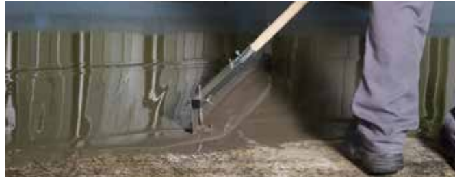
5 Auf größeren Flächen wird die Bodenausgleichsmasse mit einem Zahnrakel verteilt