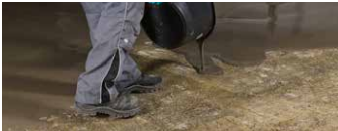
4 Direkt nach dem Anmischen in gewünschter Schichtdicke verteilen