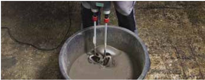
3 Mit geeignetem Rührwerk mindestens drei Minuten intensiv mischen