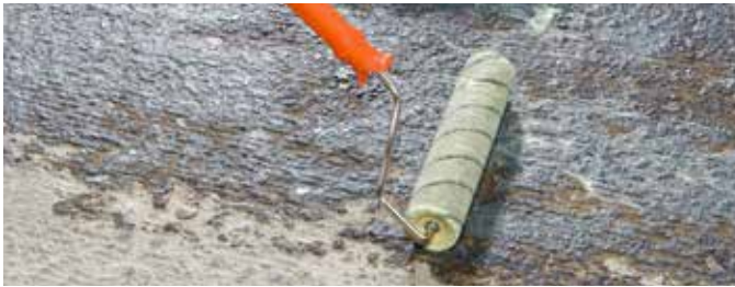
2 Grundierung mit KÖSTER SL Primer