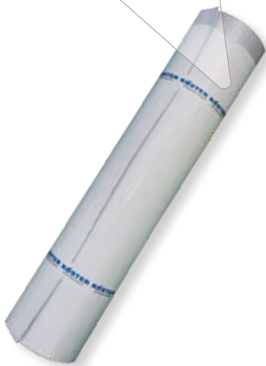
KÖSTER TPO SK (FR) Dachbahn