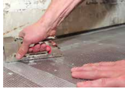
3 Aufbringen von KÖSTER Armierungsgewebe auf den Holzuntergrund