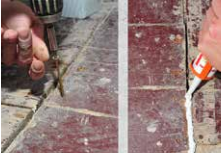
1 Untergrundvorbereitung: Befestigung loser Dielen und Verschließen von Fehlstellen