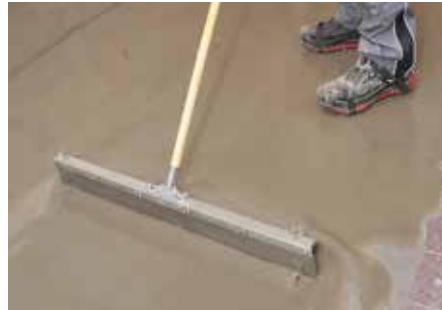
5 Auf größeren Flächen wird die Bodenausgleichsmasse mit einem Zahnrakel verteilt