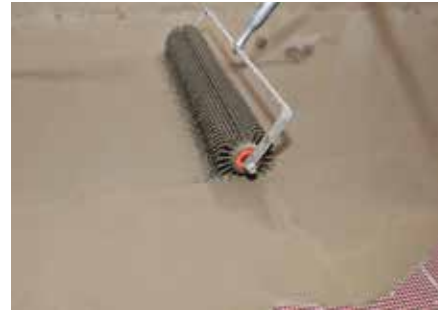
6 Abschließend das Material mit einer Stachelwalze entlüften