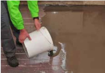
4 Direkt nach dem Anmischen (mind. 3 Minuten) in gewünschter Schichtdicke verteilen