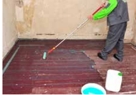
2 Grundierung mit KÖSTER VAP I 06